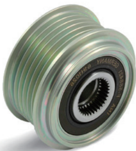
画像 2： オーバーランニングオルタネータープーリー 535 0143 10

シュフェラーオートモーティブアフターマーケット部門では、技術ソリューションとして、これらの自動車向けにオーバーランニングオルタネータープーリーを提供しています。これにより、補助ユニットドライブの動荷重を低減し、ノイズの発生を防ぎます。